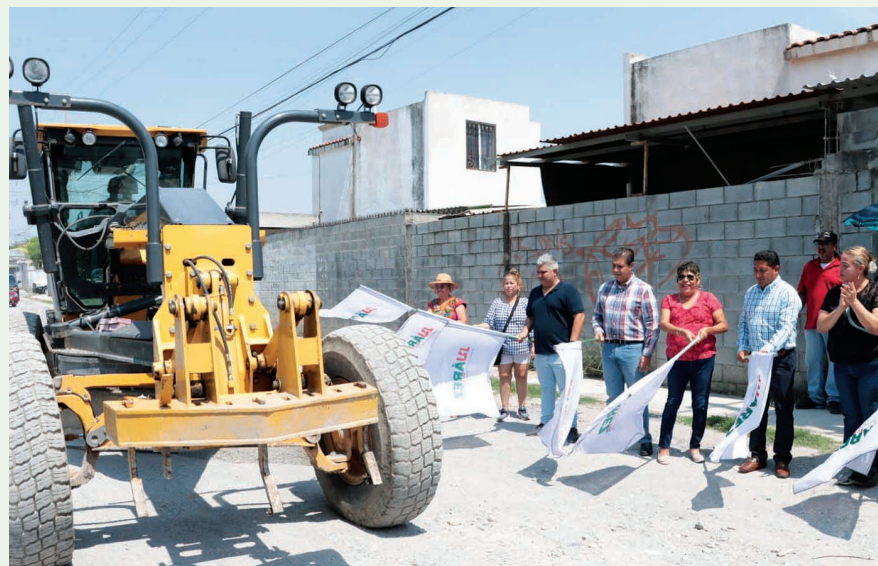
Las obras no se detienen en Juárez.