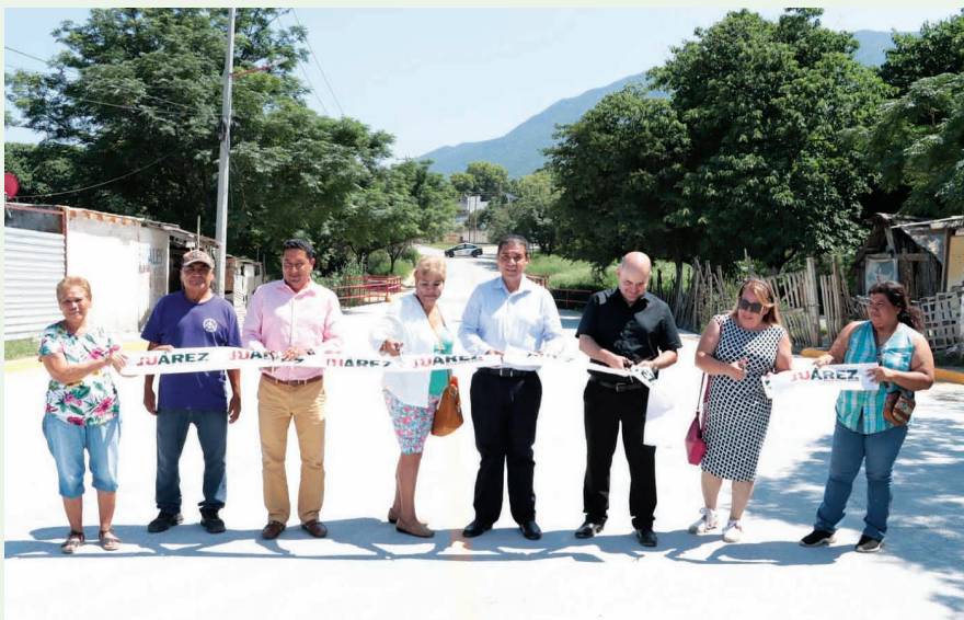
Mejores calles y avenidas tienen en Juárez.